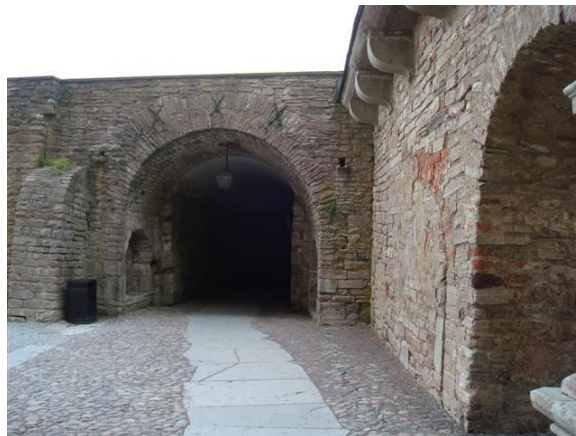
Met dikke muren

Bij Kalmar is de doorgang tussen Öland en Kalmar erg ondiep dus strategisch gezien is dit een mooie plek om een kasteel te bouwen.