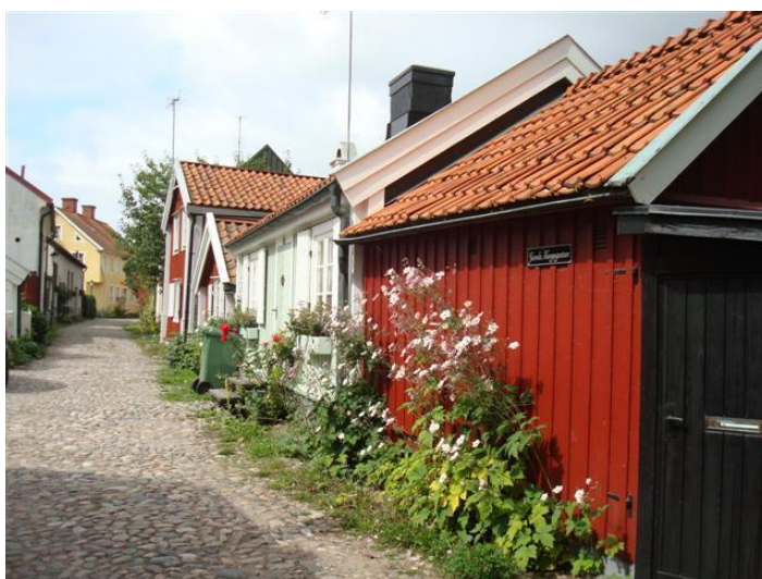
Een oud gedeelte van Kalmar

Woensdag 18 augustus voorspelling zuidwest 3-4 werkelijk?????