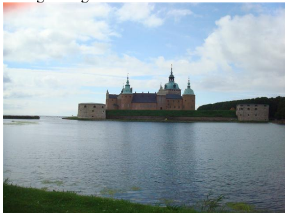
Het slot van Kalmar

De Kalmarsund ligt pal zuid en is relatief smal. Morgen is de wind 3-4- en zuid west dus blijven we binnen. We maken een fietstochtje door het plaatsje en houden het voor de rest van de dag voor gezien.